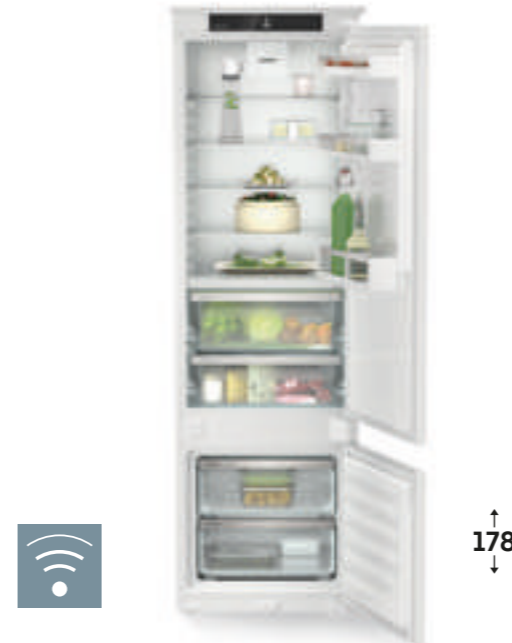
ICBbi 5122 Plus