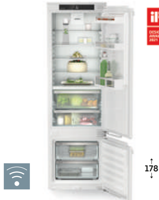
ICBbi 5152 Prime