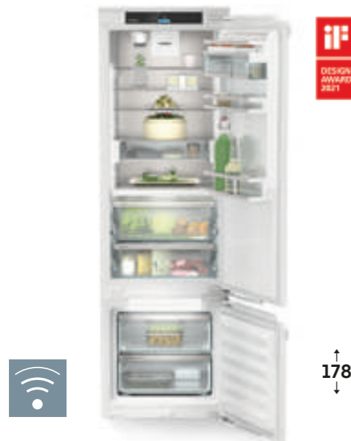
ICBci 5182 Peak